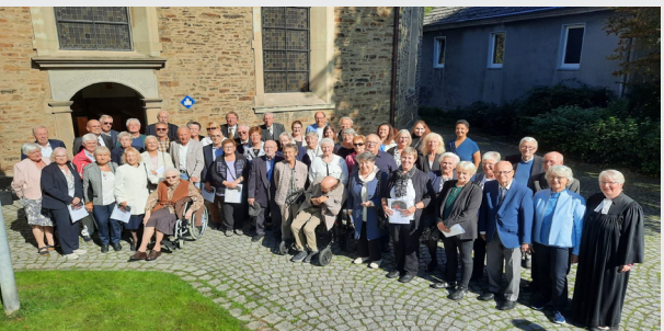
Über 50 Personen feierten im September ihre Jubelkonfirmation

Fr. 7. März 2025 17.00 Gottesdienst am Weltgebetstag, Infos, Imbiss, „wunderbar geschaffen“, Liturgie von den Cookinseln, Dorfkirche