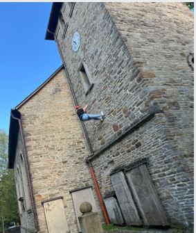
Die ev. Jugend seilt sich vom Kirchturm ab.

Bibelgesprächskreis Für Neugierige. Die Heilige Schrift: Literatur und Buch des Glaubens sowie menschlicher Fragen. Wir kommen darüber miteinander ins Gespräch. Herzliche Einladung dazu. Termine im MLG jeweils dienstags 19 - 20 Uhr. 10.12.24; 28.01.25, 25.02.25; 25.03.25