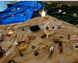
Im Kindergarten spielten wir nach, wie Gott die Welt gemacht hat.

So. 9. März 2025 10.30 Uhr Gottesdienst mit Abendmahl